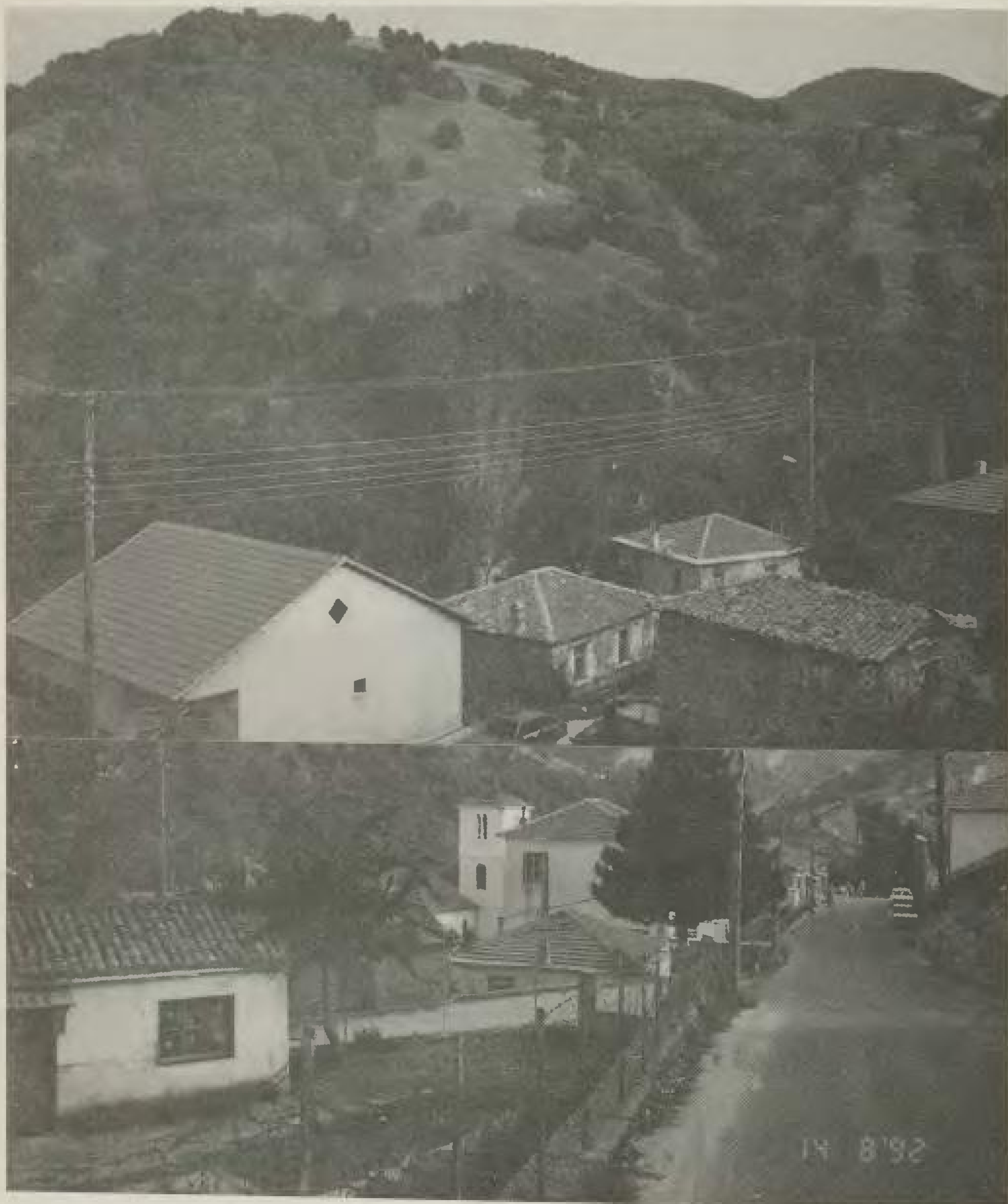
Μικρή άποψη του νέου χωριού της Δροσοπηγής. Πάνω της το δασωμένο Αλπικό τοπίο της.