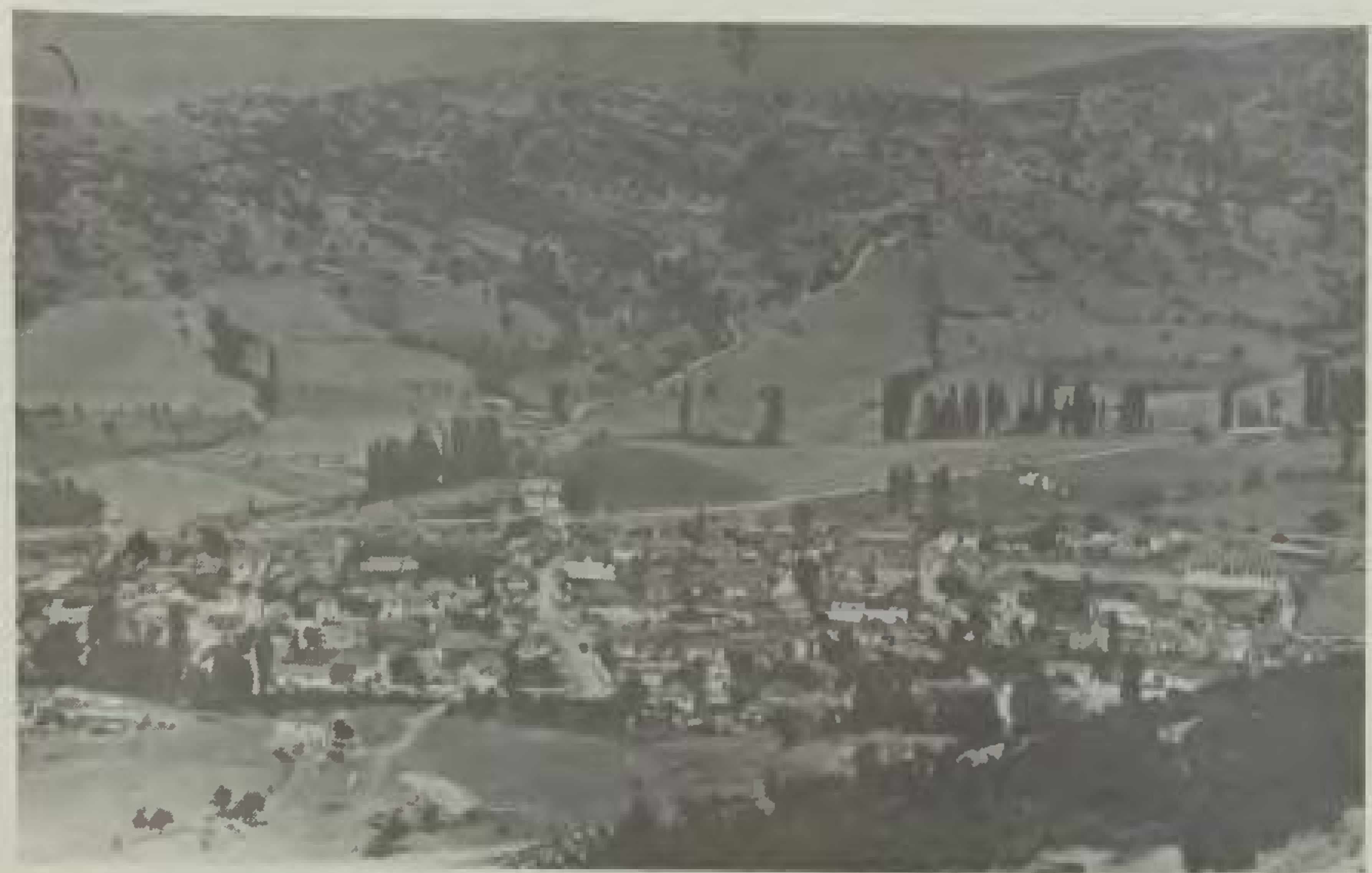
Τα Καλύβια σήμερα (φωτ. του 1984)