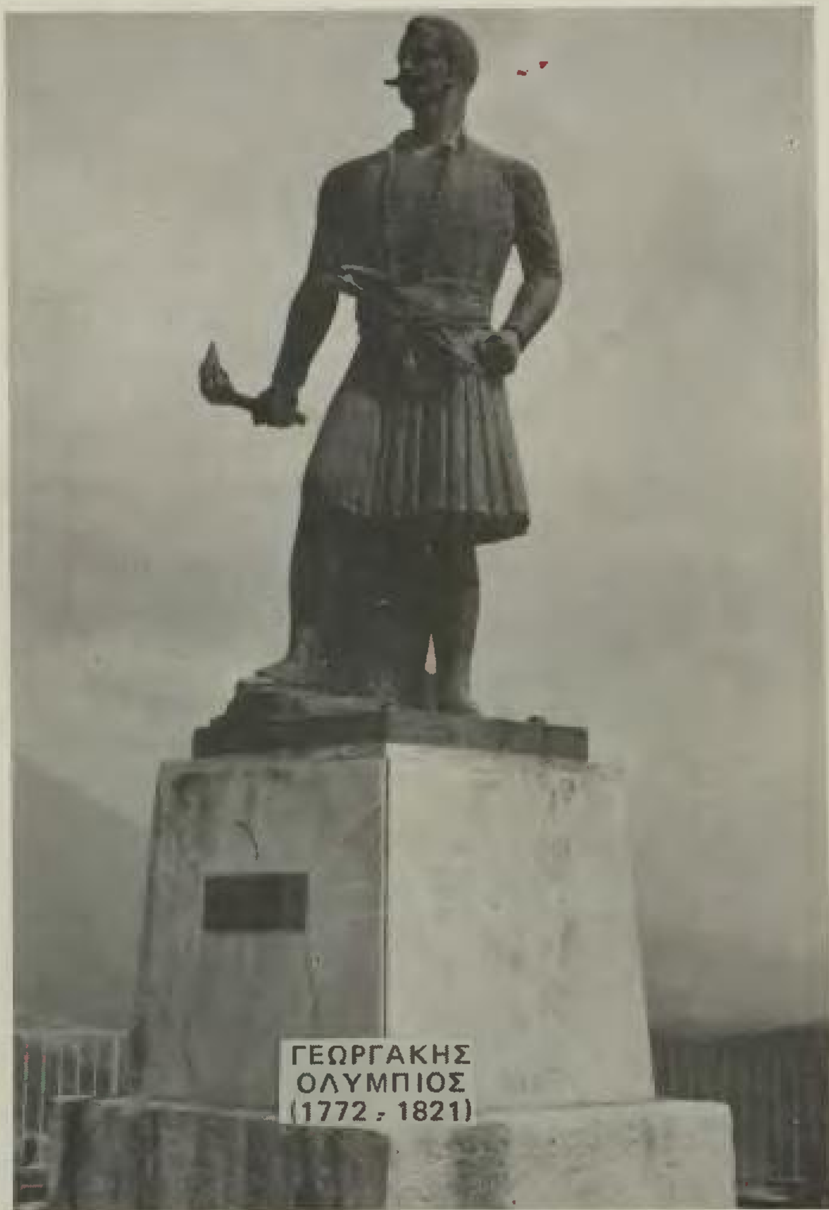
ΓΕΩΡΓΑΚΗΣ ΟΛΥΜΠΙΟΣ (1772 - 1821)