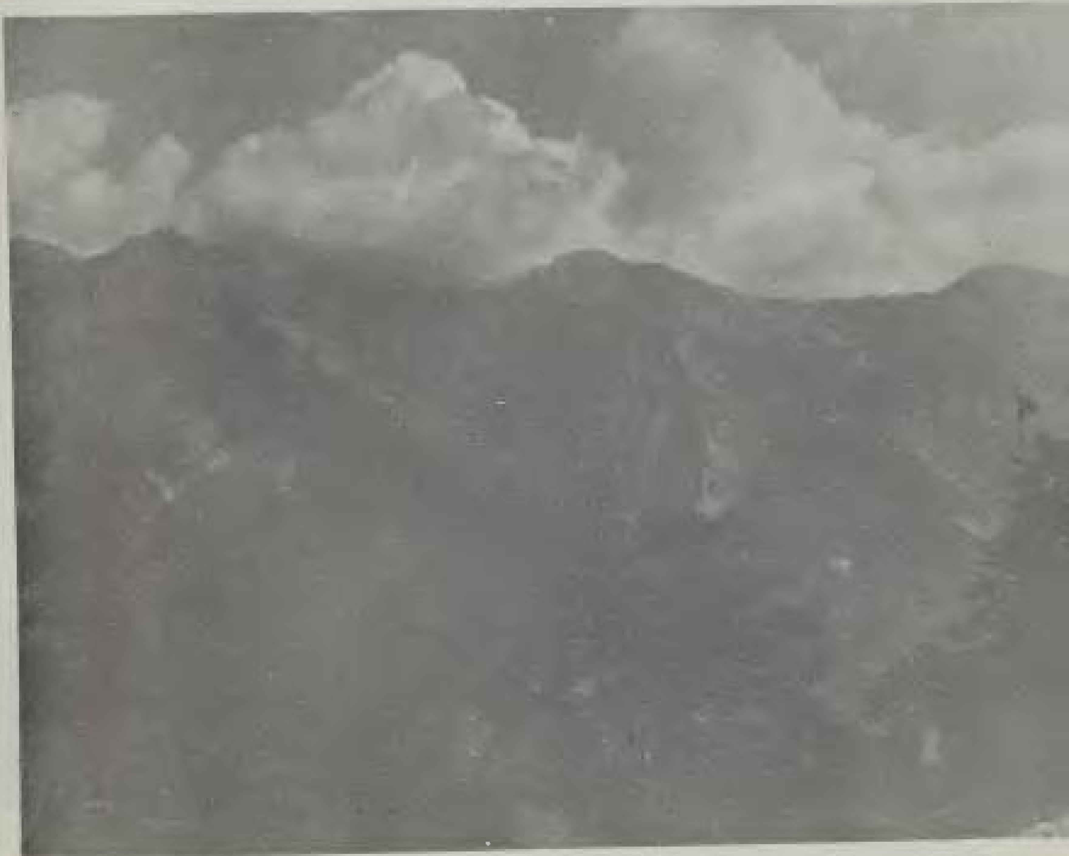
Άποψη των Κορυφών του Ολύμπου. Το βουνό, που είναι το σύμβολο της πίστης, της διανόησης και της λευτεριάς.