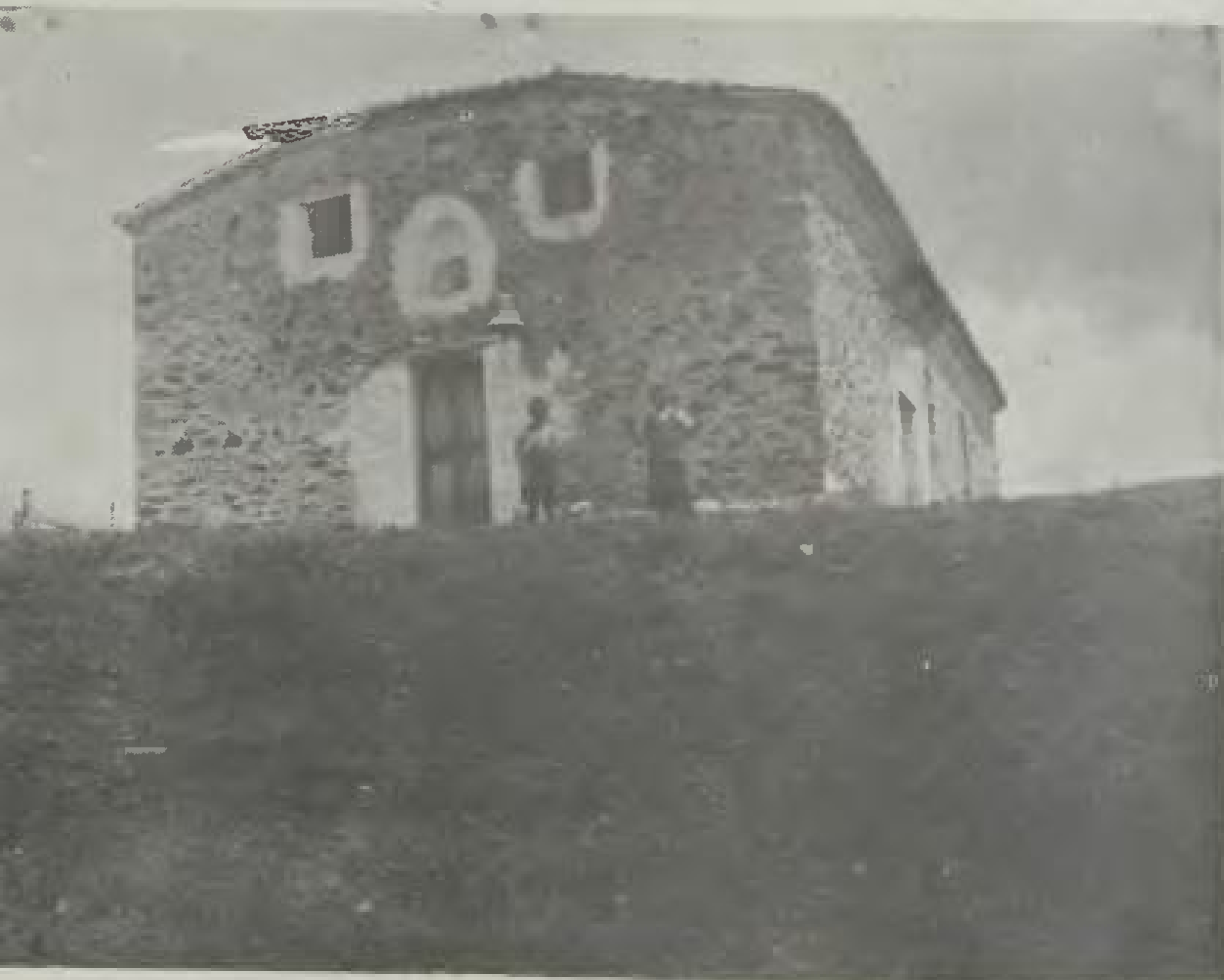
Η Εκκλησία του Αγίου Γεωργίου στο Ασπρόχωμα (Μπακαράδες) Κτίστηκε το 1916