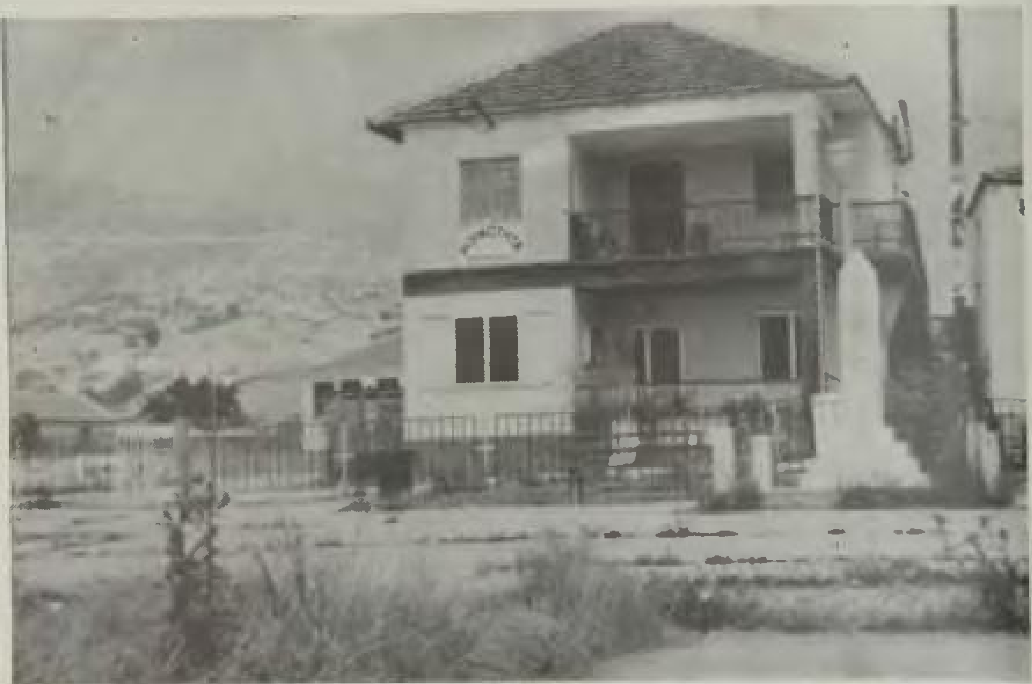
Το νεόκτιστο ιδιόκτητο γραφείο της Κοινότητας Κοκκινοπλού στα Καλύβια (φωτ. του 1984).