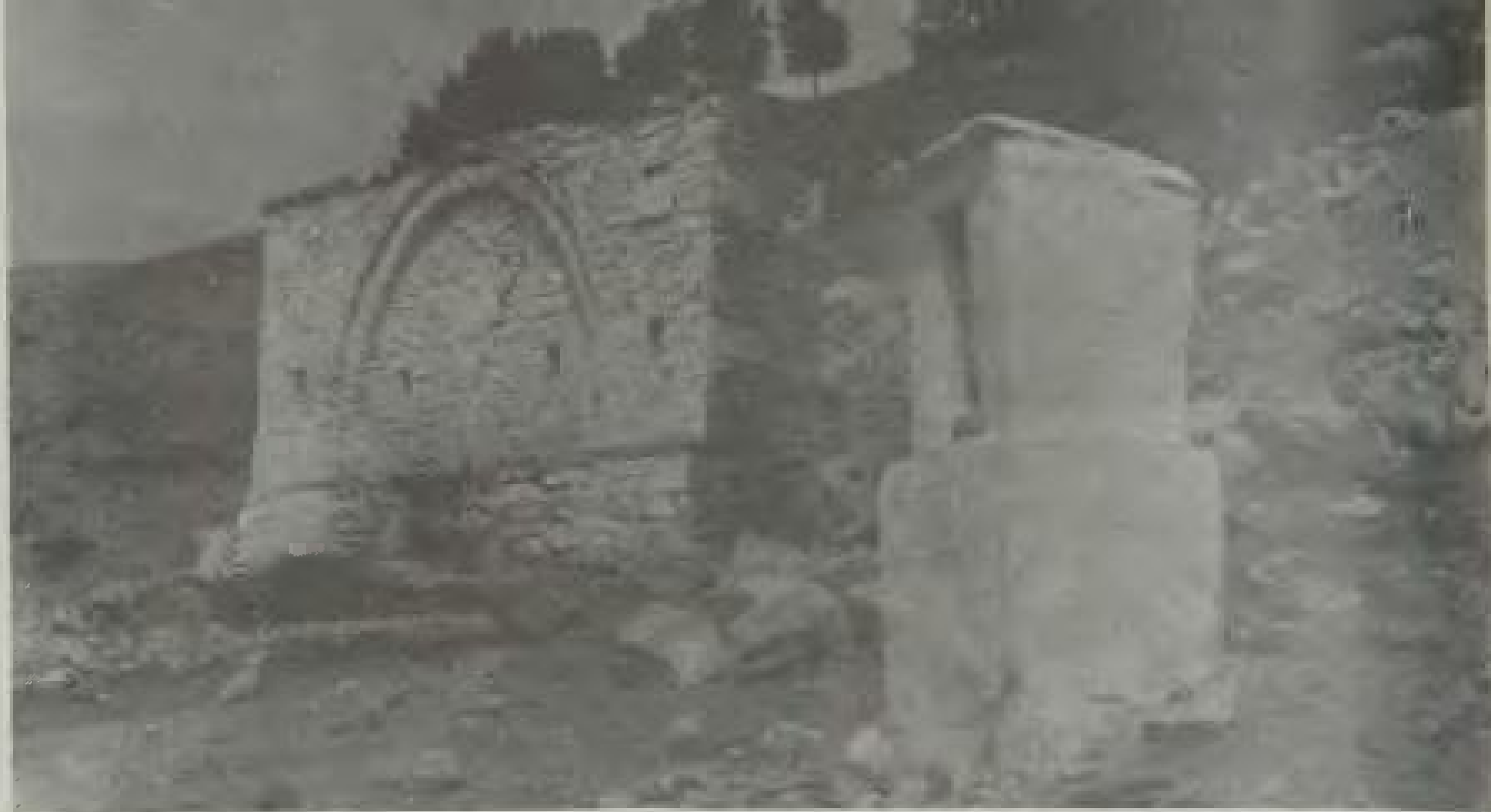
Βρύση Κρούτσιαλη (φωτ. 1955) Δίπλα στη βρύση το εικονοστάσι