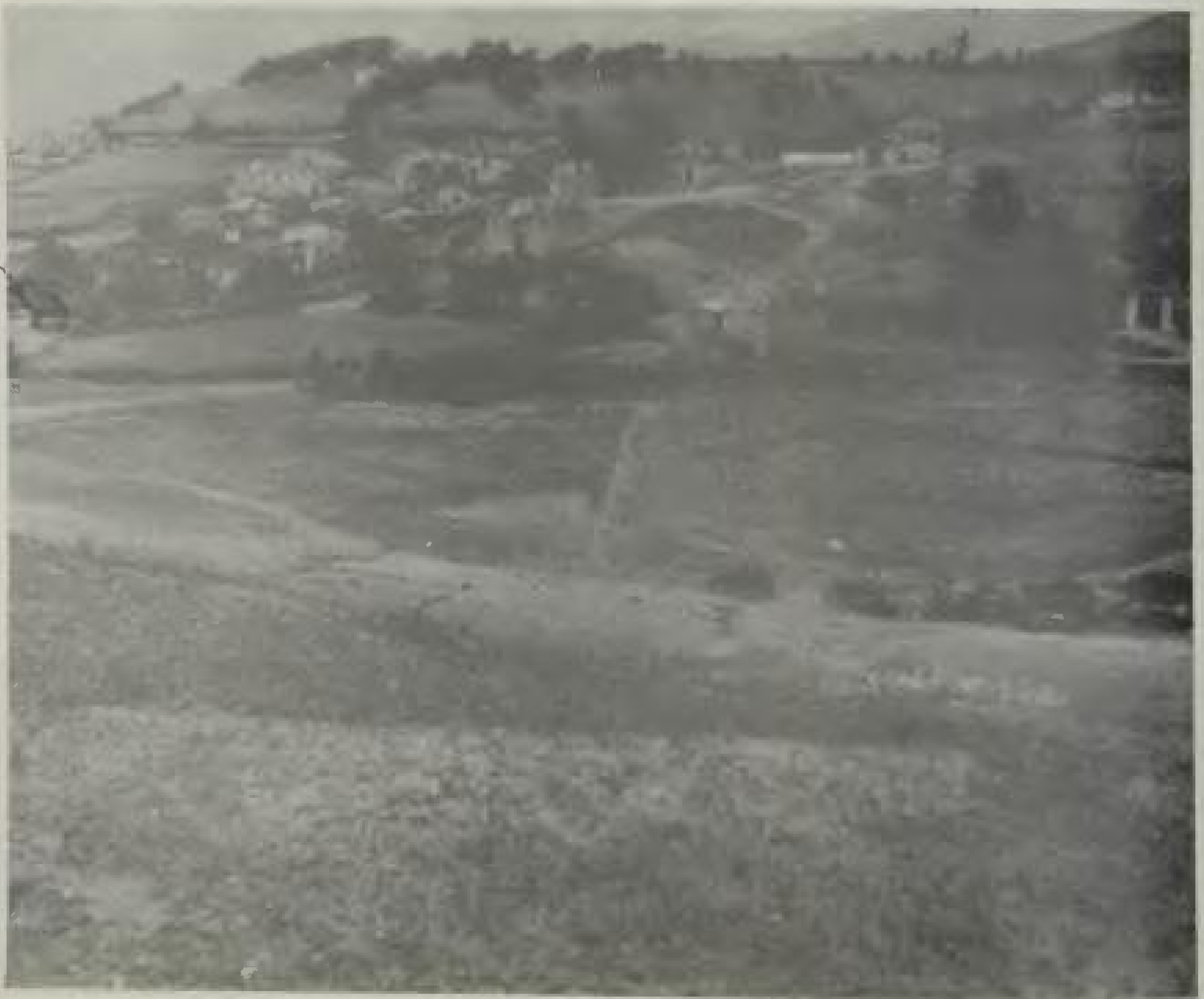
Άποψη από το Ασπρόχωμα στα μέσα της δεκαετίας του '50 (φωτ. 1955). Μέχρι το 1969 το χωριό ήταν συνοικισμός του Κοκκινοπλού.