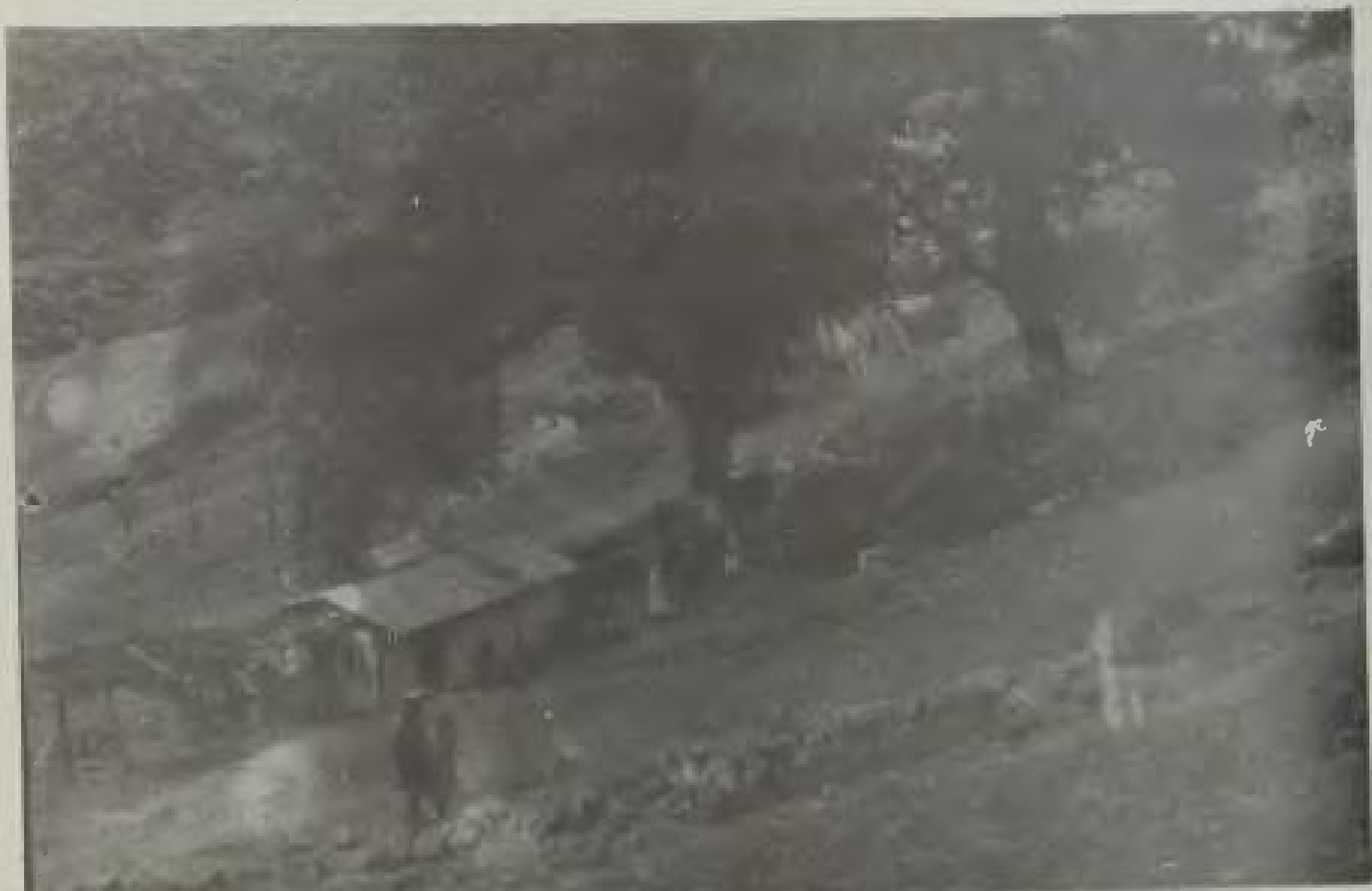
Άποψη από το πρόχειρο εστιατόριο των πρώτων μαθητικών κατασκηνώσεων στον Κοκκινοπλό. Το 1954, κτίστηκαν μοντέρνες κατασκηνώσεις, οι οποίες φιλοξενούν ακόμη και σήμερα πολλά παιδιά της περιφέρειας Ελασσόνας (φωτ. του 1954).