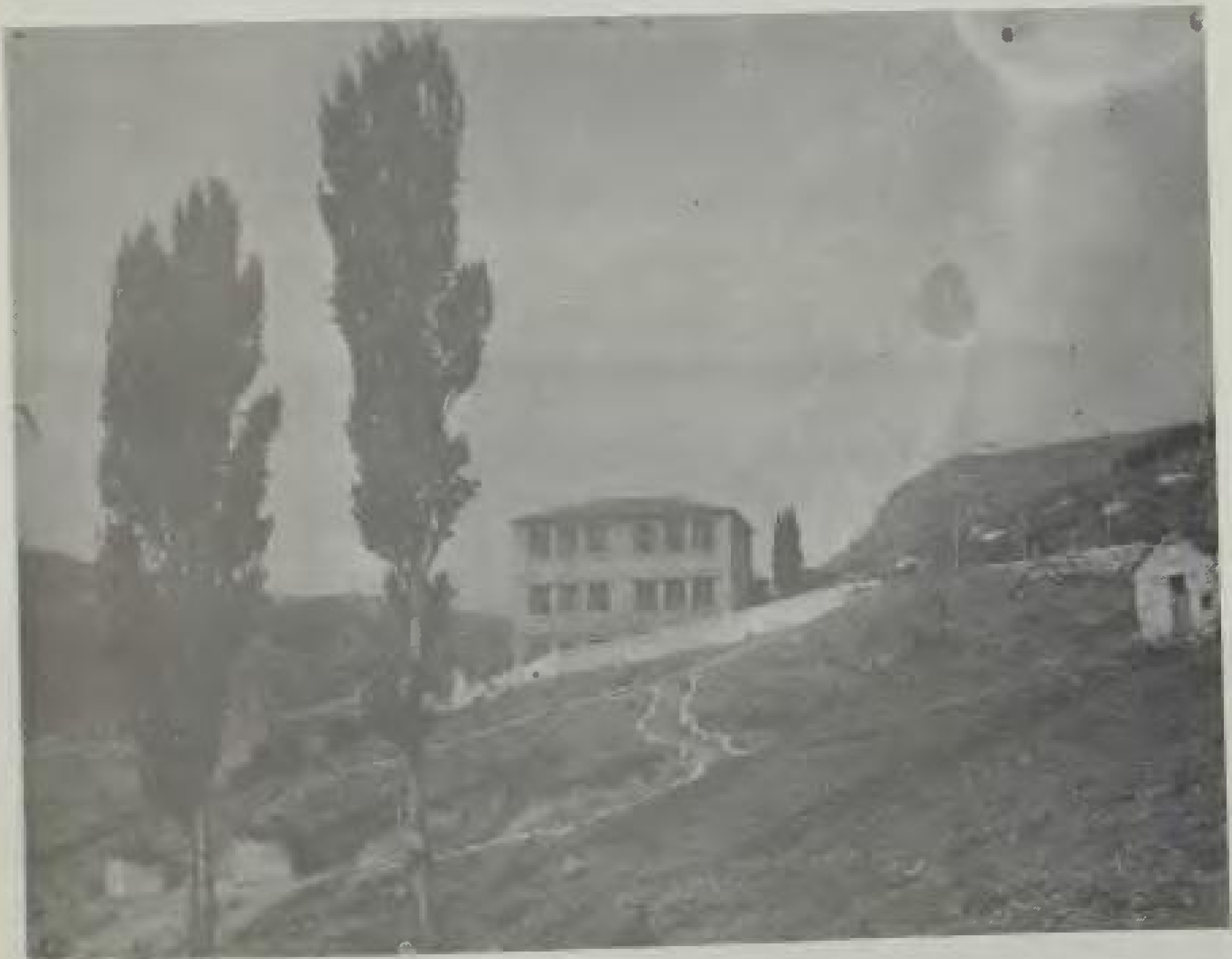
Το μεγαλοπρεπέστατο Δημοτικό Σχολείο του Κοκκινοπλού, που κτίστηκε το 1932 - 36 (φωτ. 1955). Μπροστά δεξιά μόλις διακρίνεται το θαυματουργό εικονοστάσι "Αγιονέρι".