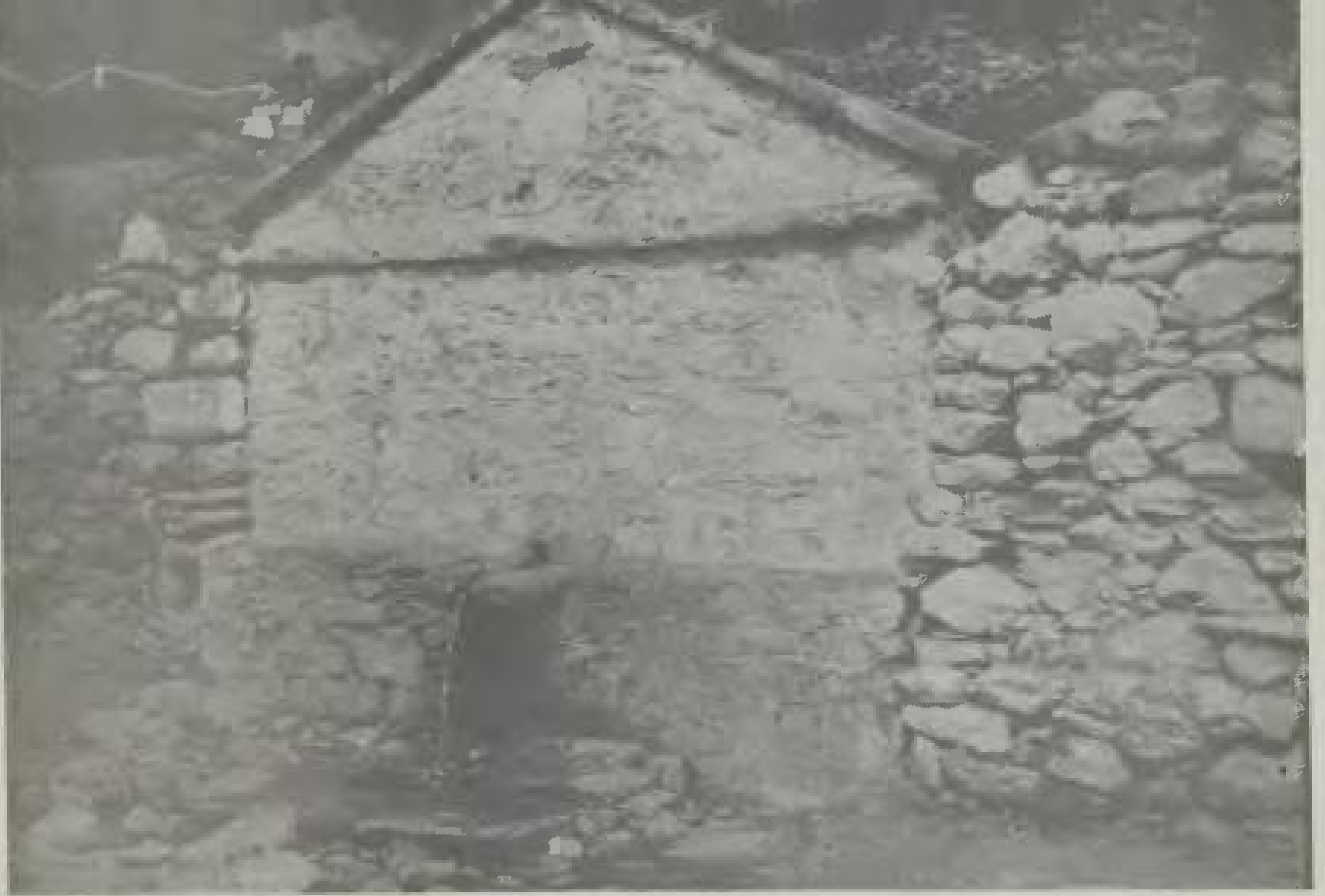
Βρύση Παπαδήμου (φωτ. 1951)