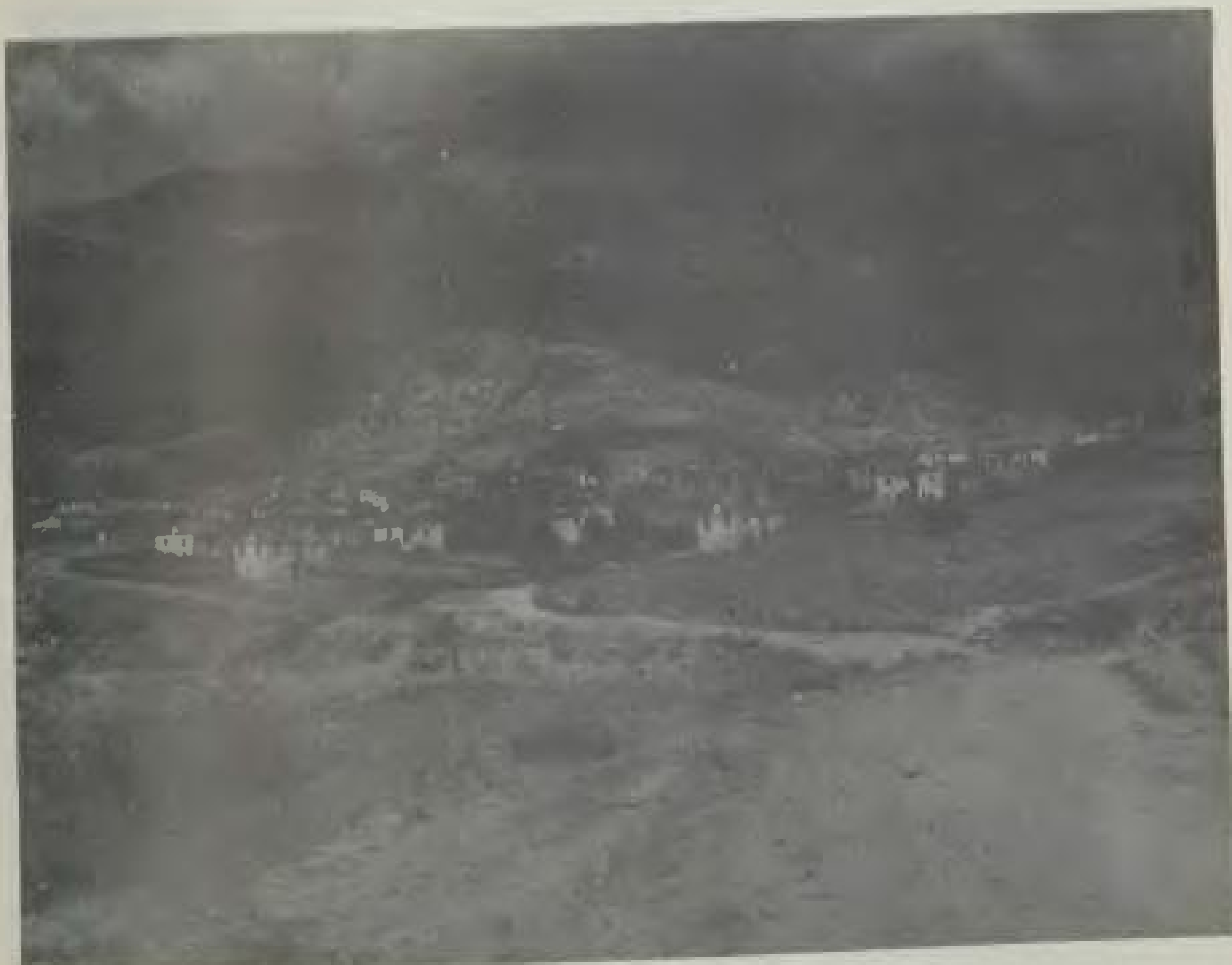
Άποψη από τα Καλύβια, το νέο χωριό των Κοκκινοπλιτών, λίγα μόλις χρόνια μετά την ίδρυσή τους (φωτ. 1954).