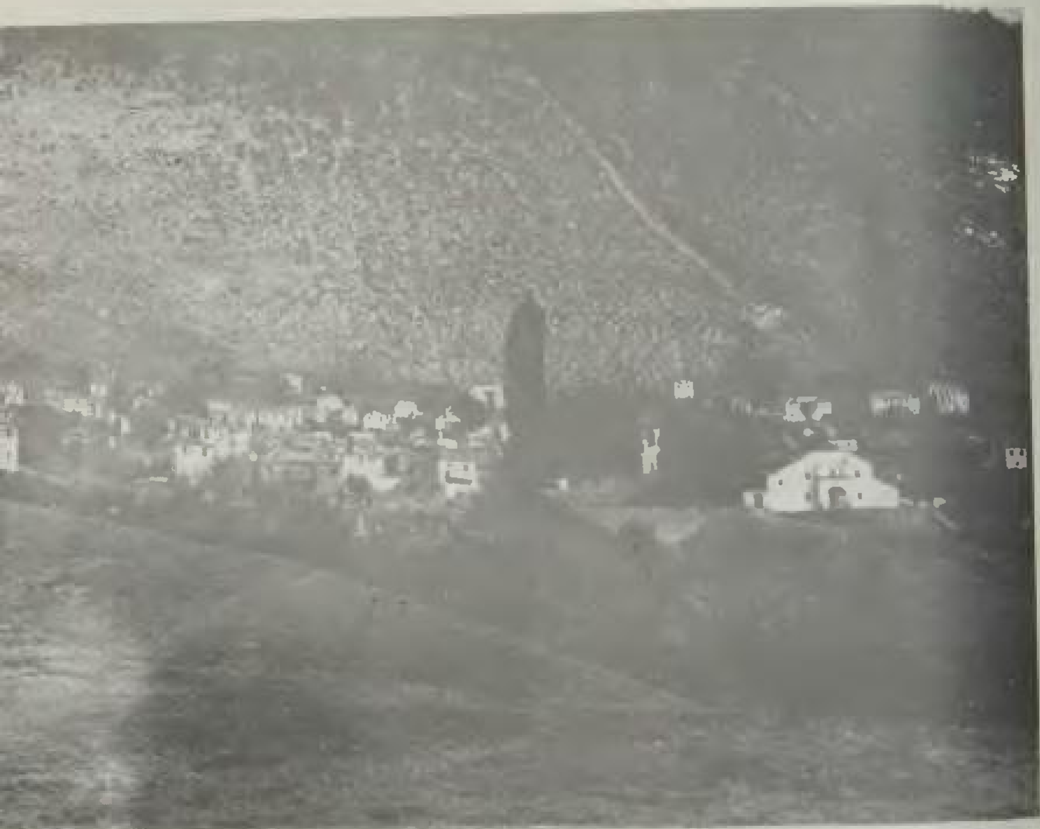
Μια άλλη άποψη του τότε Κοκκινοπλού (φωτ. του 1955), του οποίου τα σπίτια ήσαν ακόμη σκεπασμένα με πέτρινες πλάκες.