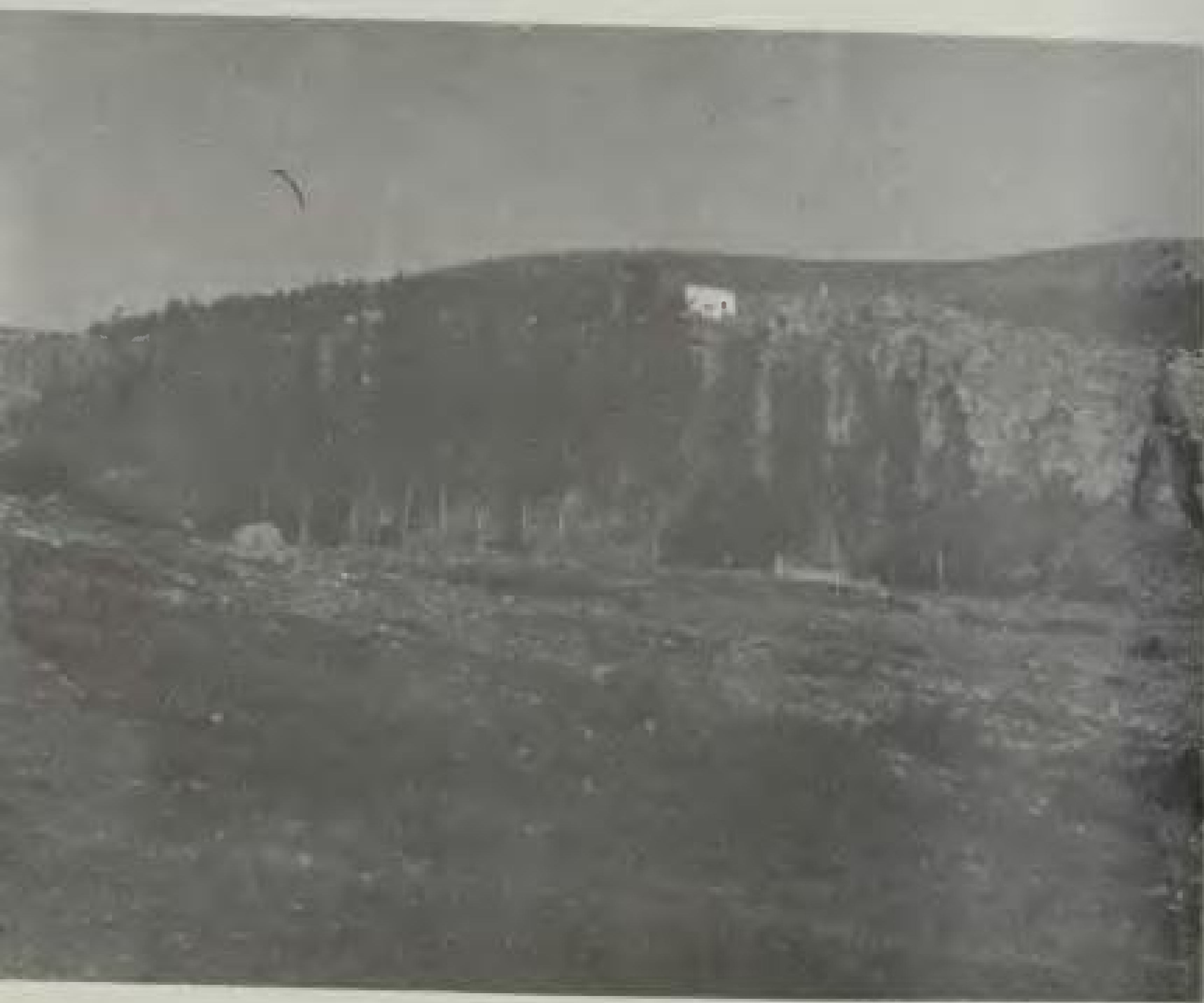
Το πάρκο – “Περιβόλι” – του Κοκκινοπλού (φωτ. του 1951). Στον γραφικό λόφο διακρίνεται ο Άγιος Αθανάσιος, που ήταν ακό- μη σκεπασμένος με πέτρινες πλάκες.