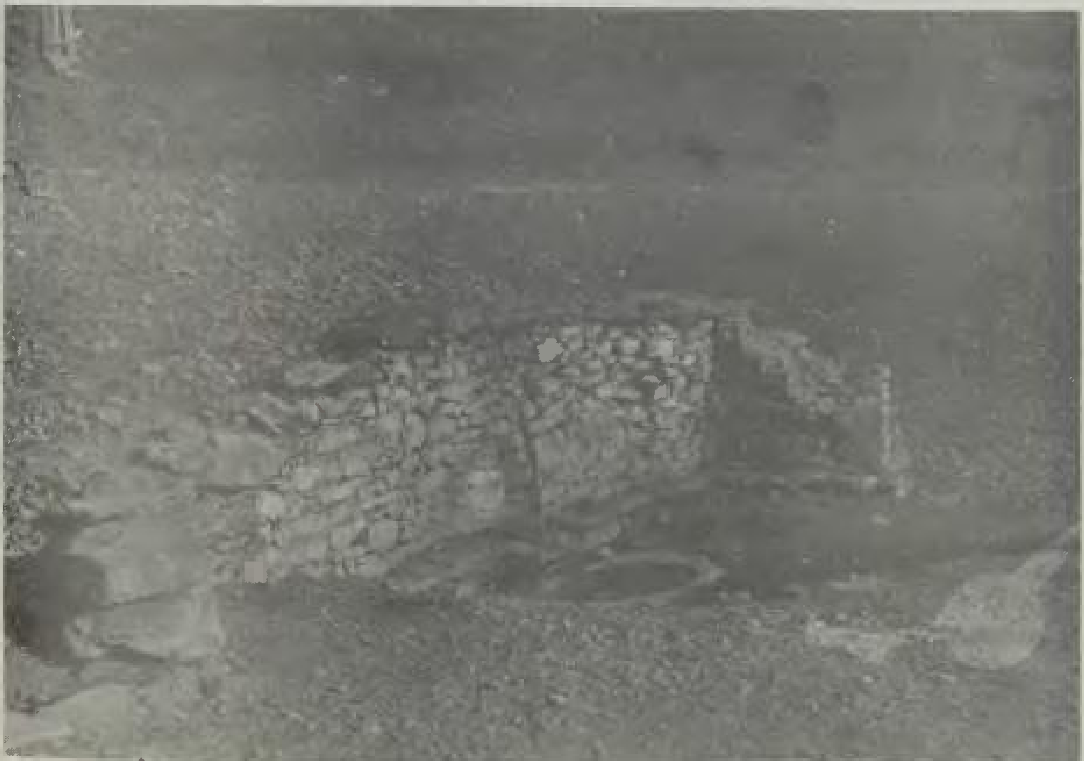
Βρύση Τσιαμάρα (φωτ. 1951)