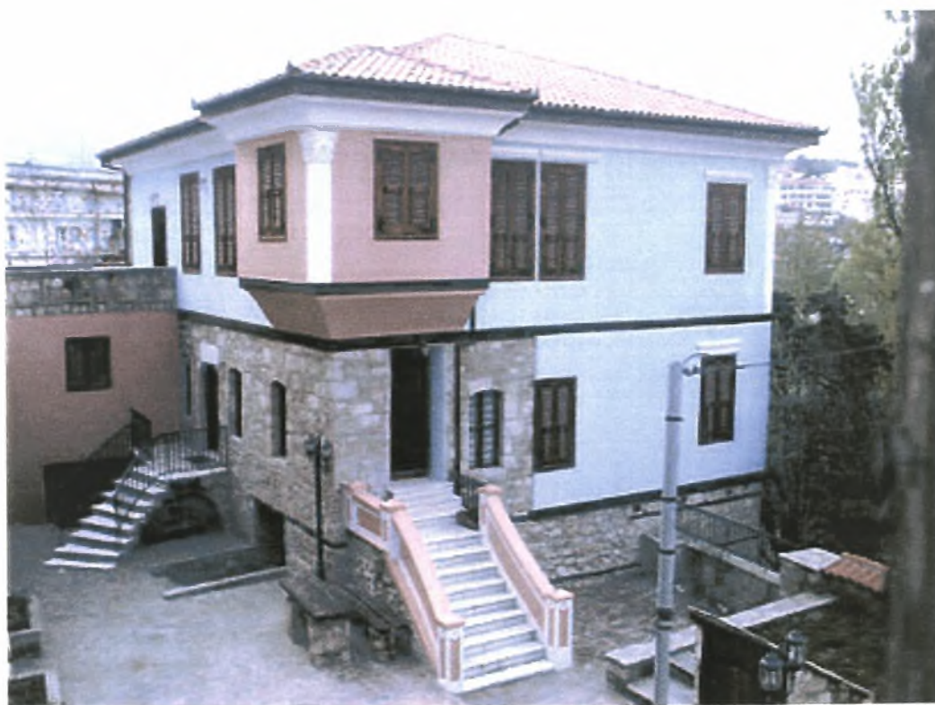
Εικόνα Νο 18: Το κτίριο του Λαογραφικού Συλλόγου Βλάχων Βέροιας

<<Τραγούδια από τη ζωή των Βλάχων>>. Συνεργάστηκε στην έκδοση βιβλίων και γύρισε δύο ταινίες μικρού μήκους.