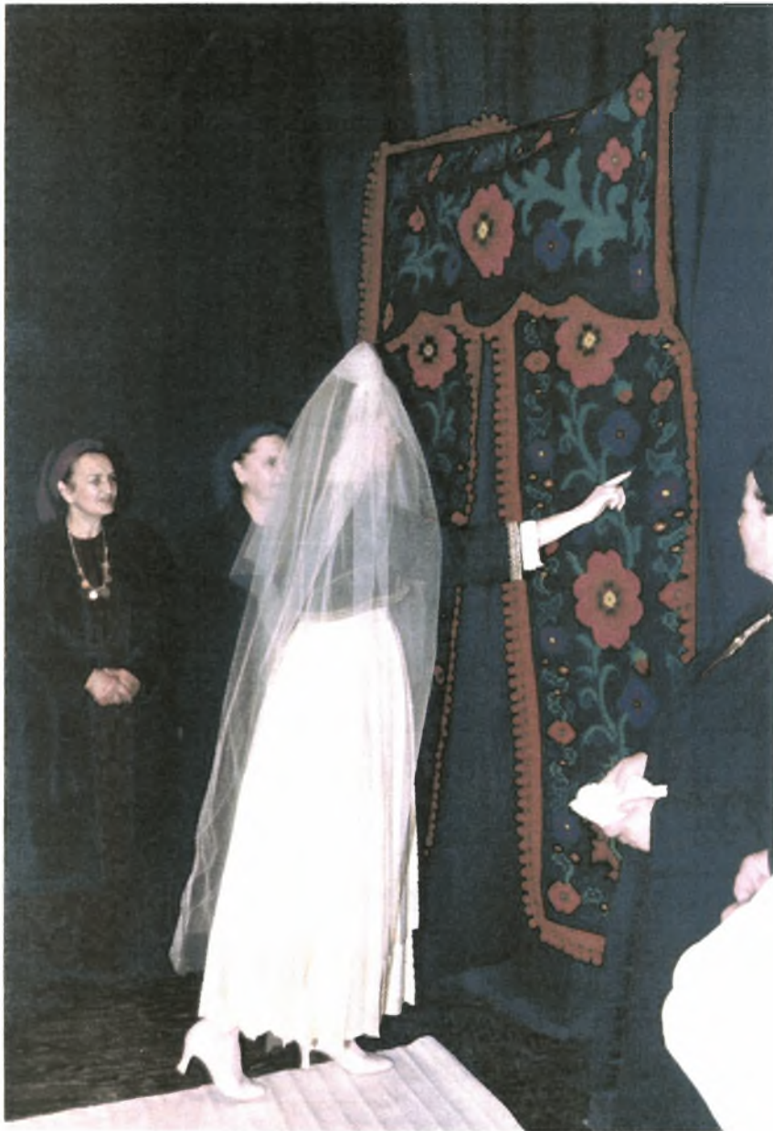
Εικόνα Νο.10: Η νύφη δείχνει τα προικιά. (Αναπαράσταση βλάχικου γάμου από Σύλλογο βλάχων Βέροιας)

τηγάνια, ταψιά, τεντζερέδες για το νέο σπιτικό που θα ανοίξουν οι νιόπαντροι. Τα δώρα αυτά έχουν ανταποδοτικό χαρακτήρα.