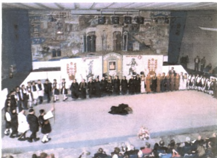
Εικόνα Νο.7: Χορός των Βλάχων της Βέροιας στη Θεσσαλονίκη (1993)