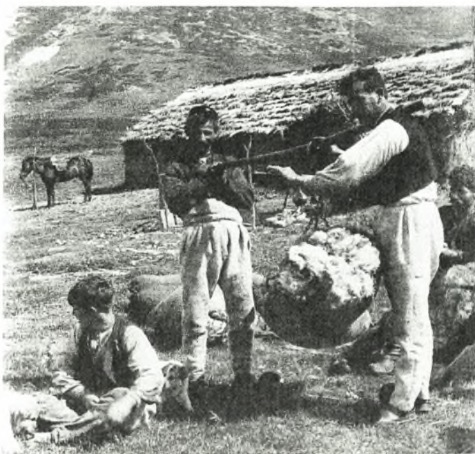
Εικόνα No.1 Βλάχοι κτηνοτρόφοι

μεταφορείς όχι μόνο προϊόντων αλλά και ιδεών, σύνδεσμος του Ελλαδικού χώρου με τον ευρύτερο Βαλκανικό και την Ευρώπη.