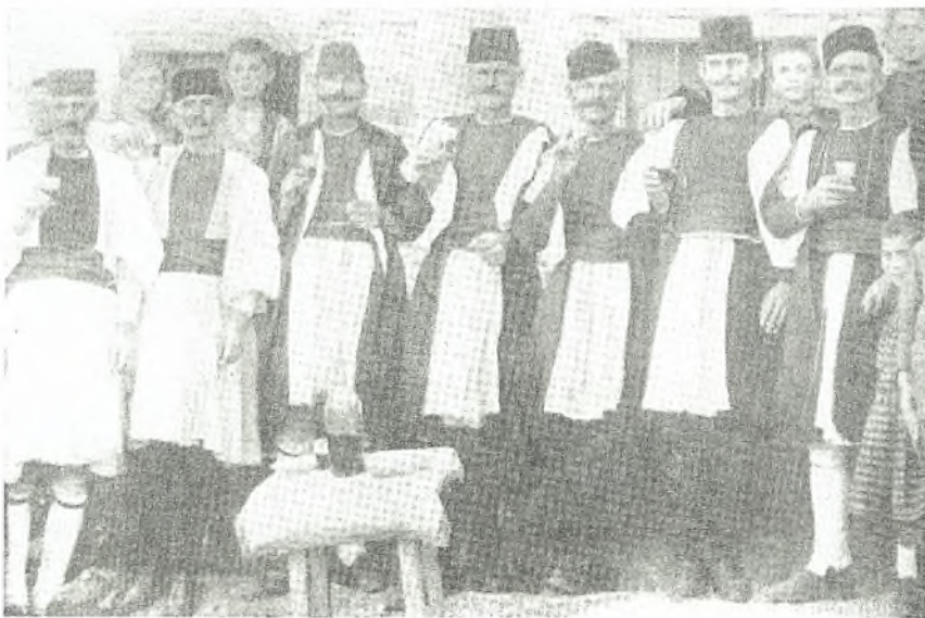
Εικόνα Νο.9: Από βλάχικο αρραβώνα στην Αβδέλα (1927)

Στη διάρκεια του αρραβώνα, οι συγγενείς του γαμπρού πάνε κάπου κάπου στην νύφη με <<ποάμιλε>> (φρούτα). Καθένας τους αγοράζει ένα μαντήλι και γλυκά. Τα βάζουν σ' ένα καλάθι, το σκεπάζουν με άσπρο πανί, το δίνουν σ' ένα αγόρι να το κουβαλήσει στο κεφάλι του, και πηγαίνουν στην νύφη. Πρώτα πηγαίνει το αγόρι και μετά οι αδερφές και ξαδέρφες εκείνου που στέλνει τα δώρα. Μόλις δεχτεί η νύφη τα δώρα και τα βγάλει από το καλάθι, βάζει στη θέση τους τρία ζευγάρια κάλτσες πλεκτές και ένα μαντήλι για τον κουβαλητή. Τη Σαρακοστή οι συγγενείς του γαμπρού στέλνουν και πάλι δώρα με τον ίδιο τρόπο, αλλά αντί για γλυκά βάζουν χαλβά. Το Πάσχα ο γαμπρός στέλνει στη νύφη μια λαμπάδα για την Ανάσταση.