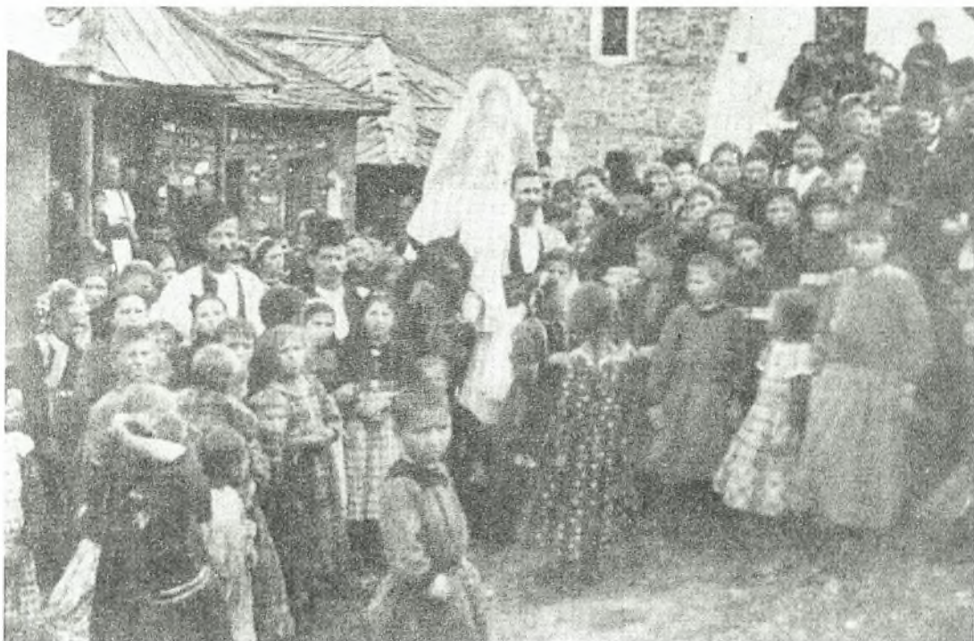
Εικόνα Νο 14: Οι συμπθέροι παίρνουν τη νύφη – Σαμαρίνα (1911)

Όλοι μαζί, νύφη, γαμπρός, κουμπάρος και συγγενείς παίρνουν το δρόμο για την εκκλησία. Μπροστά πηγαίνουν οι μουσικοί και οι τραγουδιστές. Στο δρόμο, δεξιά και αριστερά, περιμένουν όλοι σχεδόν οι κάτοικοι του χωριού, οι οποίοι ακολουθούν κι εκείνοι μετά τη γαμήλια πομπή στην εκκλησία.