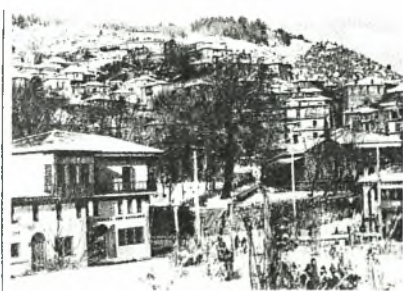
Εικόνα Νο.2 Το Μέτσοβο

Τη Χώρα Μετσόβου αποτέλεσαν τα χωριά Μηλιά Μετσόβου, Ανήλιο, Βοτονόσι, Ανθοχώρι, Μαλακάσι, Πλατάνιστος, καθώς και οι μικροί οικισμοί που φέρονται να υπήρχαν στις θέσεις των σημερινών χωριών Παναγία και Καλυβοχώρι. Η περιοχή τους απολάμβανε προνομιακό καθεστώς αυτονομίας και αυτοδιοίκησης. Από τα βλαχοχώρια της <<Χώρας Μετσόβου>>, το Μέτσοβο, το Συρράκο και οι Καλαρίτες γνώρισαν στιγμές μεγάλης δόξας και πλούτου κατά τη διάρκεια του 18 ου και τις αρχές του 19 ου αιώνα. Όμως μόνο το Μέτσοβο μπόρεσε να παραμείνει ακμαίο μέχρι και σήμερα, παραμένοντας ο μεγαλύτερος και ακμαιότερος βλάχικος οικισμός σε όλη τη Βαλκανική. Οι περισσότεροι από τους Βλάχους του Νότιου Μαλακασίου ή Βλαχοτζουμέρκου έχουν σκορπίσει ως πρώην παραχειμάζοντας νομαδοκτηνοτρόφοι, εμποροβιοτέχνες και εσωτερικοί μετανάστες κυρίως στα Γιάννινα, την Πρέβεζα και τα χωριά του Θεσσαλικού κάμπου, όπως και τα πεδινά χωριά της Άρτας, μέχρι και στα χωριά του Ξηρόμερου στην Αιτωλοακαρνανία.