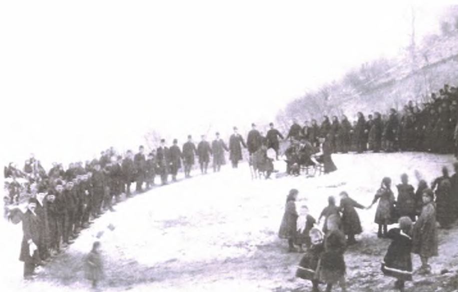
Εικόνα Νο.6: Χορός των Βλάχων της Βέροιας στην Κουμαριά (1906)

βλάχικοι σκοποί : συγκαθιστά, στρωτά, μπεράτια, τσάμικα, κυρατζίδικα και κτηνοτροφικά. Άλλα είναι καθιστικά και άλλα χορευτικά.