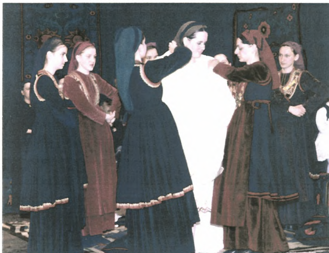
Εικόνα Νο.12: Το στόλισμα της νύφης από τις φιλενάδες της. (Αναπαράσταση βλάχικου γάμου από Σύλλογο βλάχων Βέροιας)