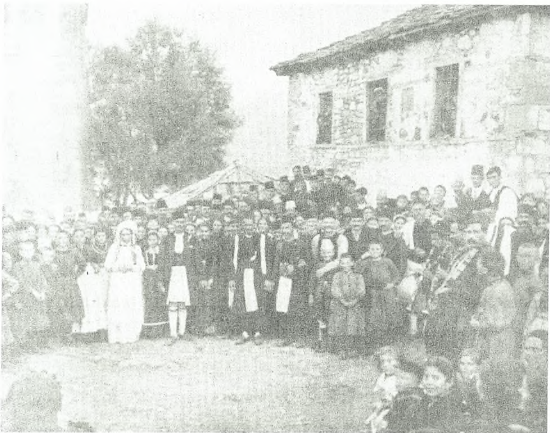
Εικόνα Νο 15: Η νύφη στο σπίτι του γαμπρού μετά τα στέφανα – Σαμαρίνα (1911)

παραλαβής>>. Τα χέρια της νύφης τώρα τα κρατούν ο πατέρας και ο θείος του γαμπρού. Ο πατέρας του γαμπρού δίνει στο συμπέθερό του χρήματα, ως ένδειξη ευγνωμοσύνης.