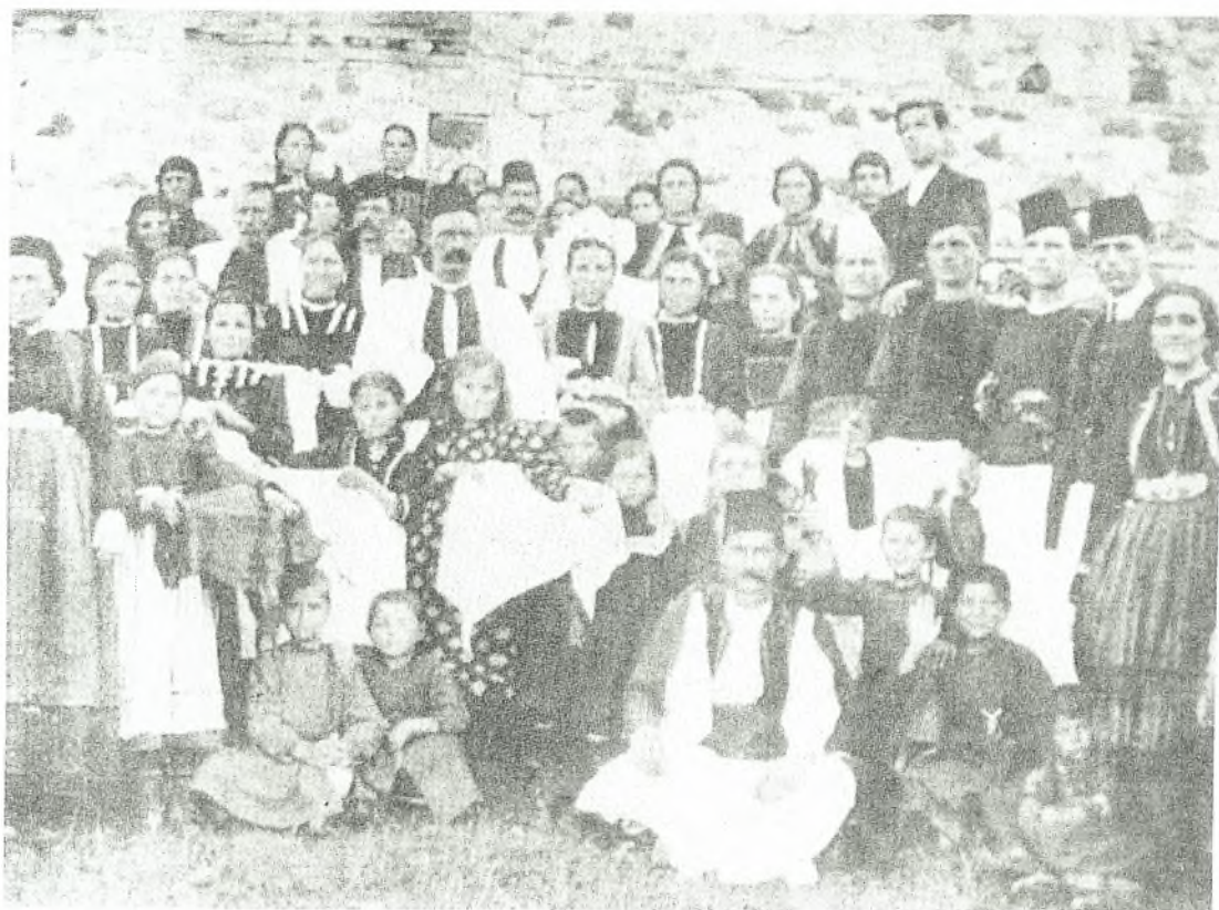
Εικόνα Νο 16 : Οι συγγενείς πηγαίνουν την παπάρα –Σαμαρίνα (1911)