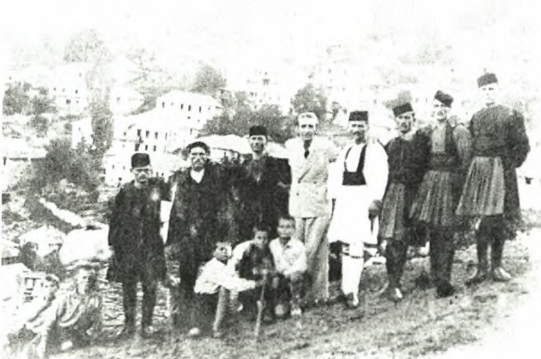
Εικόνα Νο.3: Βλάχοι στην Αβδέλα

Κατά τη διάρκεια του 20 ου αιώνα, οι κάτοικοι που παρέμεναν συνδεδεμένοι με τους μητροπολιτικούς οικισμούς ακολούθησαν την πορεία της οριστικής εγκατάστασης, κυρίως στις περιοχές των παραδοσιακών θεσσαλικών χειμαδιών και περισσότερο στις επαρχίες των Τρικάλων, της Ελασσόνας, του Τυρνάβου, της Λάρισας και του Βόλου.