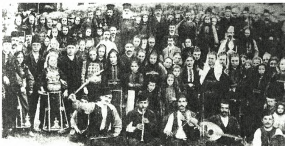
Εικόνα Νο.8: Γλέντι βλάχικου γάμου στο χωριό Βρυσοχώρι του Ζαγορίου

Κομπανίες με κλαρίνα και βιολιά που αποδίδουν αυθεντικά τα βλάχικα τραγούδια υπάρχουν πολλές ακόμη και σήμερα, κυρίως στα Γρεβενά, που ασχολούνται με μεράκι και πάθος με την παραδοσιακή μουσική και αποδίδουν με εκπληκτική ακρίβεια τα βλάχικα τραγούδια. Επίσης, σήμερα, πολλά νέα παιδιά μαθαίνουν παραδοσιακά όργανα και επανδρώνουν τις κομπανίες των συλλόγων, όπως της Βέροιας, των Σερρών, του Βελεστίου.