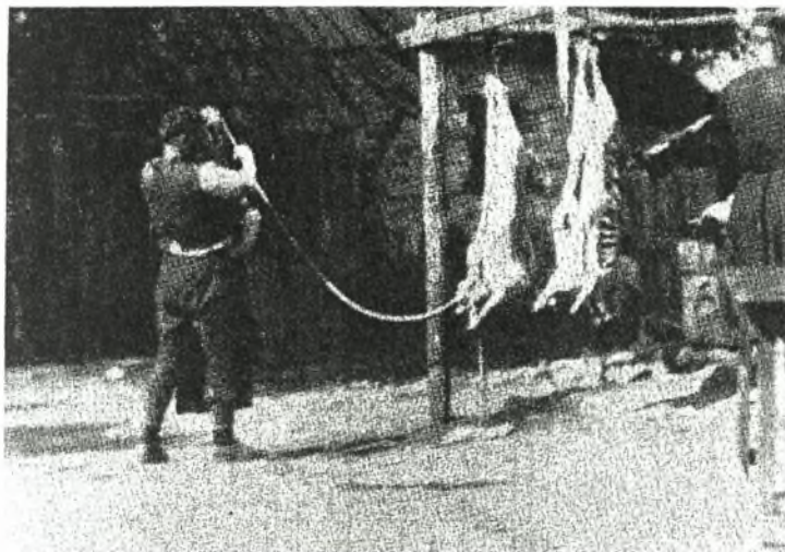
Εικόνα Νο.11: Τα σφαχτά του γάμου-Αβδέλα (1927)

Στενοί συγγενείς φέρνουν σφαχτά (κανίσκια) και οι φίλοι και σχεδόν όλο το χωριό, κουλούρες από ζυμωτό ψωμί.